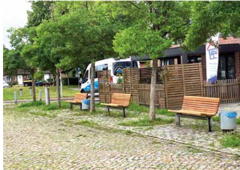
Auch die Bänke wurden erneuert

Was zum Dorffest 2022 mit gemeinsamem Malen begann, sich dann in mehreren Workshops mit unterschiedlich vielen Teilnehmenden fortsetzte und mit einer Präsentation kurz vor Weihnachten 2023 auf dem Dorfplatz endete, hat nun endlich sein Ziel erreicht