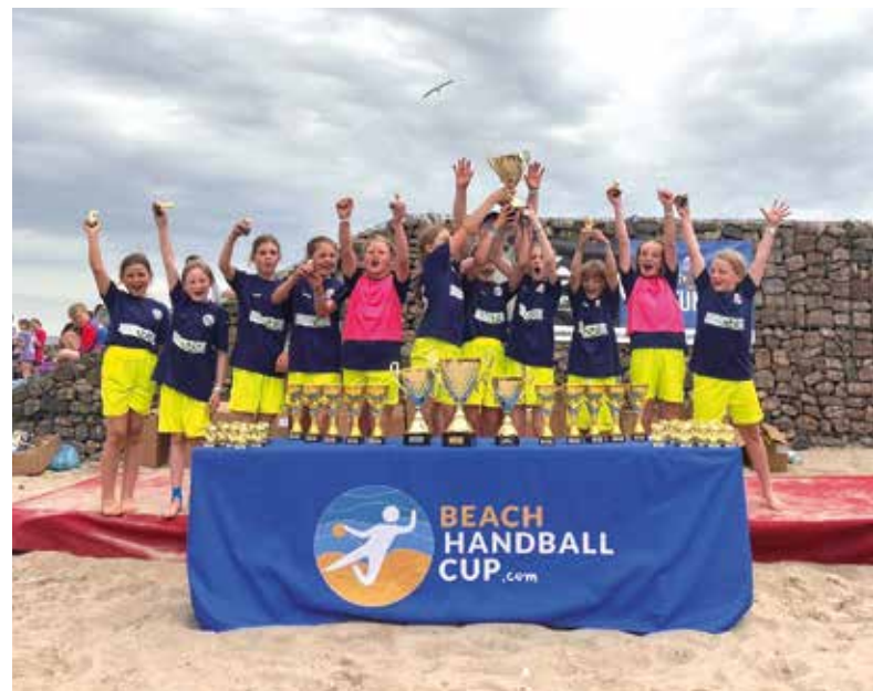
E-Jugend vom TuS Felde