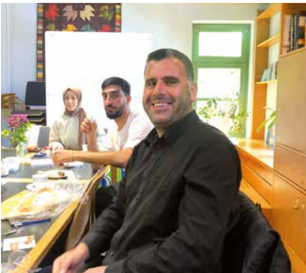
Beim Café Vielfalt im Gemeindezentrum