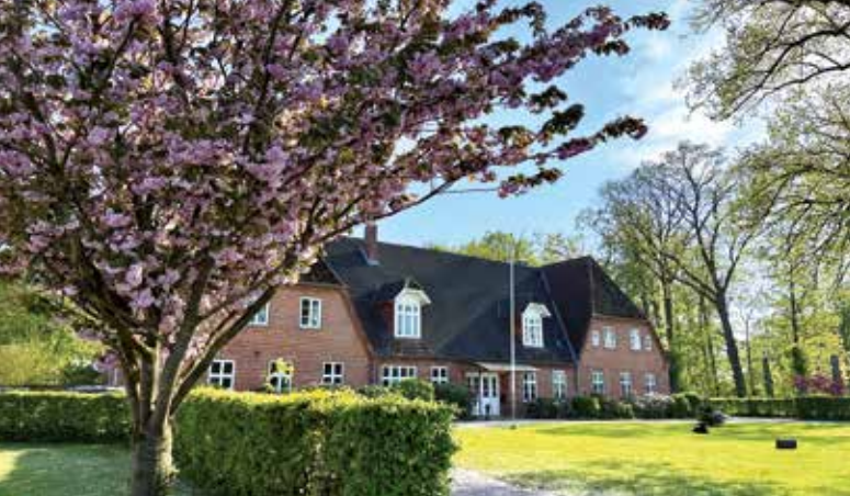
Das Wohnhaus hat die Jahrhunderte gut überstanden

Neu Nordsee - dieser Teil von Felde ist vielen unbekannt. Die meisten kennen den Parkplatz an der Autobahn 210 zwischen Achterwehr und Bredenbek. Oder man kommt an dem grünen Ortsschild vorbei, wenn man auf der Landstraße von Felde nach Bredenbek fährt. Aber sonst ...?