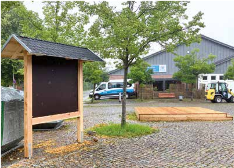
Plakatwand und Bühne