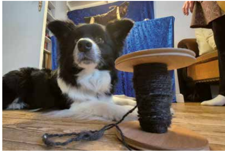
flauschige Wollfäden aus Hundehaar