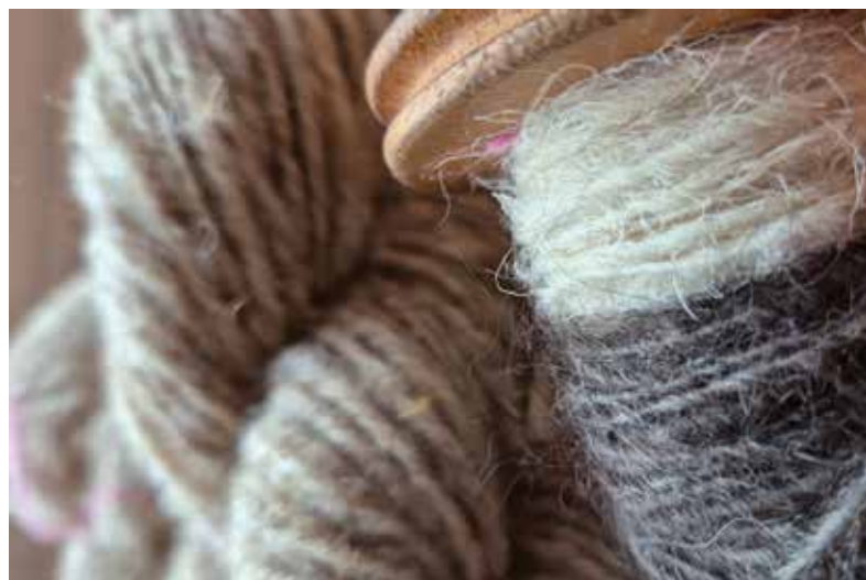
Fertige Wollknäuel und unverzwirnte Fäden auf der Spule