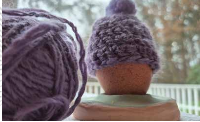
ein Eierwärmer aus selbstgesponnener Wolle

Antonia, „dann habe ich es aus Versehen einmal richtig gemacht, und der Wollfaden wurde viel schöner“.