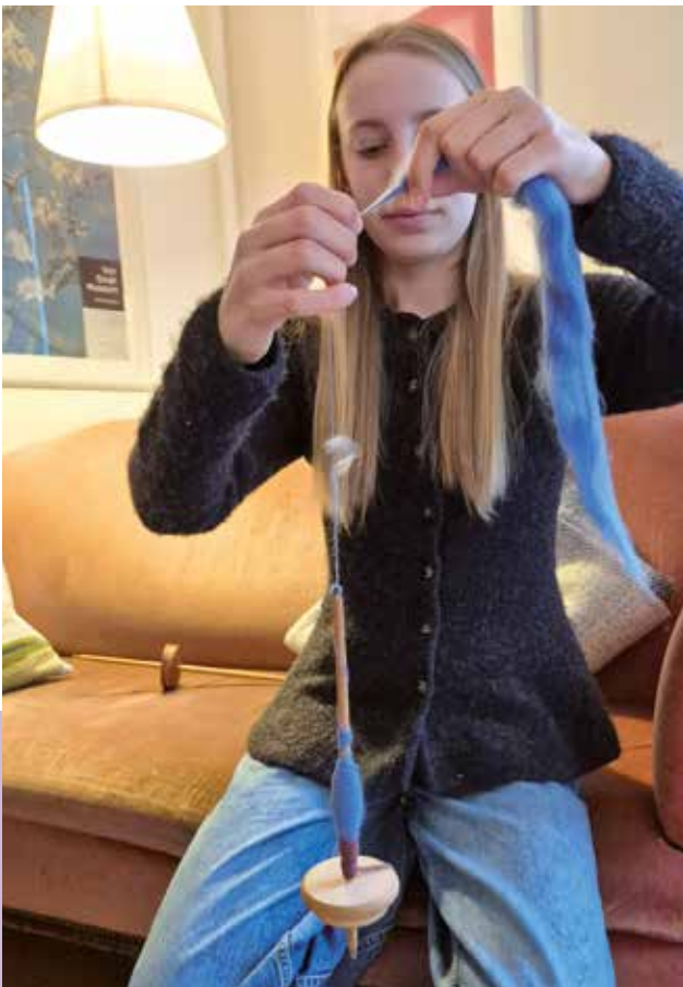
mühsames Arbeiten mit der Spindel