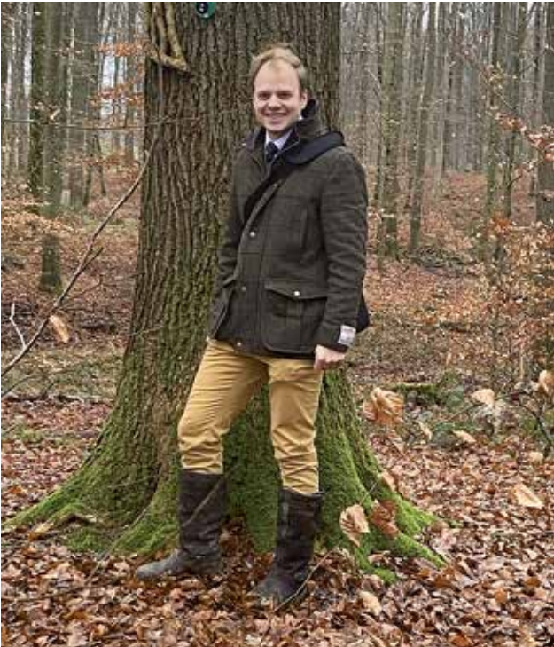
Vicco von Bülow

Vor den Toren der Gemeinde Felde gibt es im Felder Holz seit Kurzem einen Bestattungswald. Wir haben an einer Führung teilgenommen, um uns einen Eindruck zu verschaffen.